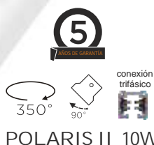
POLARIS II 10W