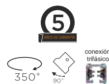
POLARIS II 20W